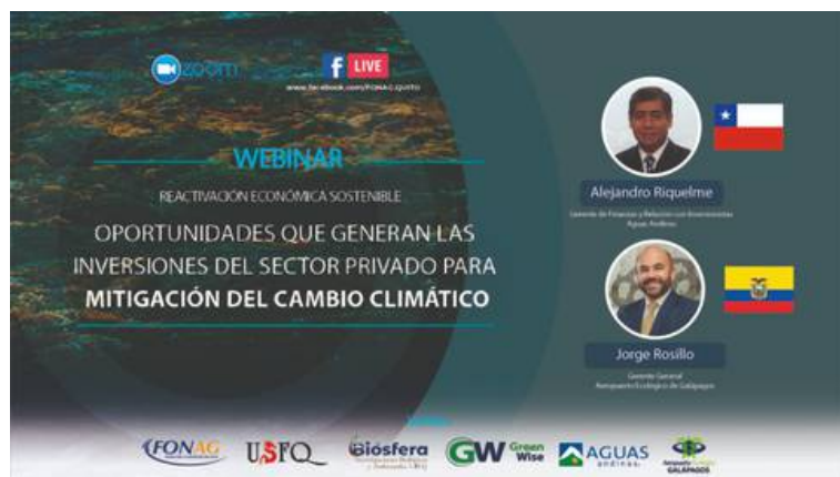
Arte del Webinar "Oportunidades que generan inversiones del sector privado para mitigación del cambio climático"

Green Wise co-organizó con el FONAG, Ecogal, Aguas Andinas, USFQ, el Instituto Biosfera, el Webinar "Oportunidades que generan inversiones del sector privado para mitigación del cambio climático", el 9 de septiembre de 2021. Se discutieron temas de Proyectos ambientales en el país, propuestas de bonos de carbono, consecuencias del cambio climático en los glaciares del país, cambio climático, implementación de nuevos temas en relación con la sostenibilidad.