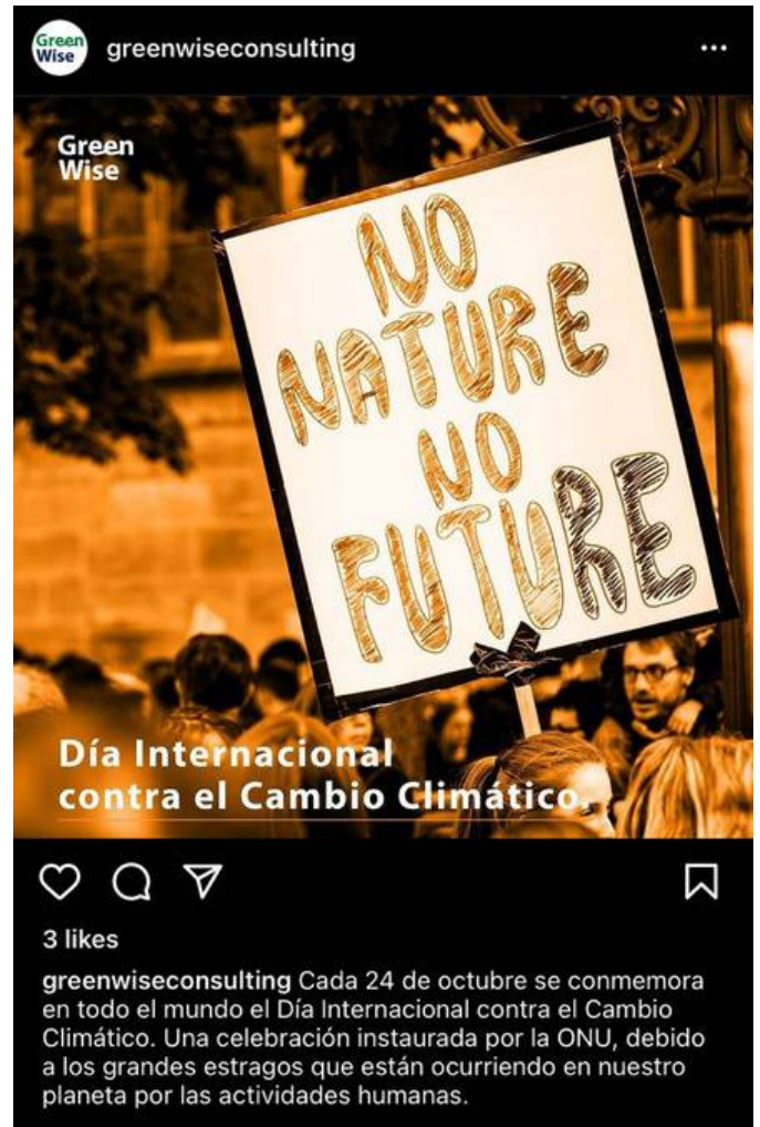
Publicaciones informativas en el Instagram de la organización