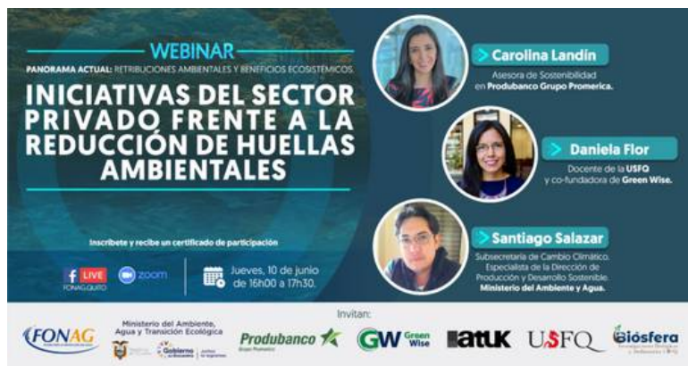
Arte del Webinar "Iniciativas del sector privado frente a la reducción de huellas ambientales"

Green Wise participó en el webinar "Iniciativas del sector privado frente a la reducción de huellas ambientales", el 10 de junio de 2021. En este espacio se discutió temas de acciones de reducción y compensación nacional para llegar a la carbono neutralidad, cálculo de huella hídrica y medios de compensación/remediación, y la contaminación ambiental en los ríos.