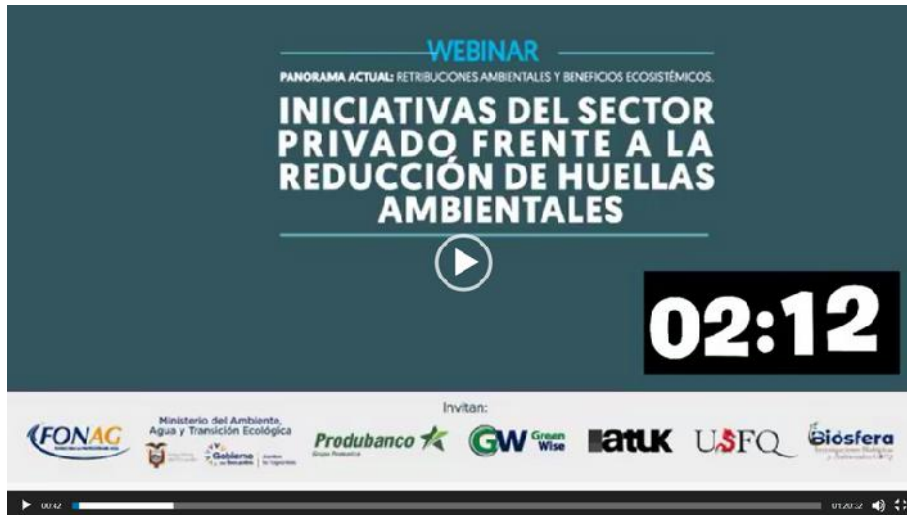
Participación de GW en el webinar "Iniciativas del sector privado frente a la reducción de huellas ambientales"